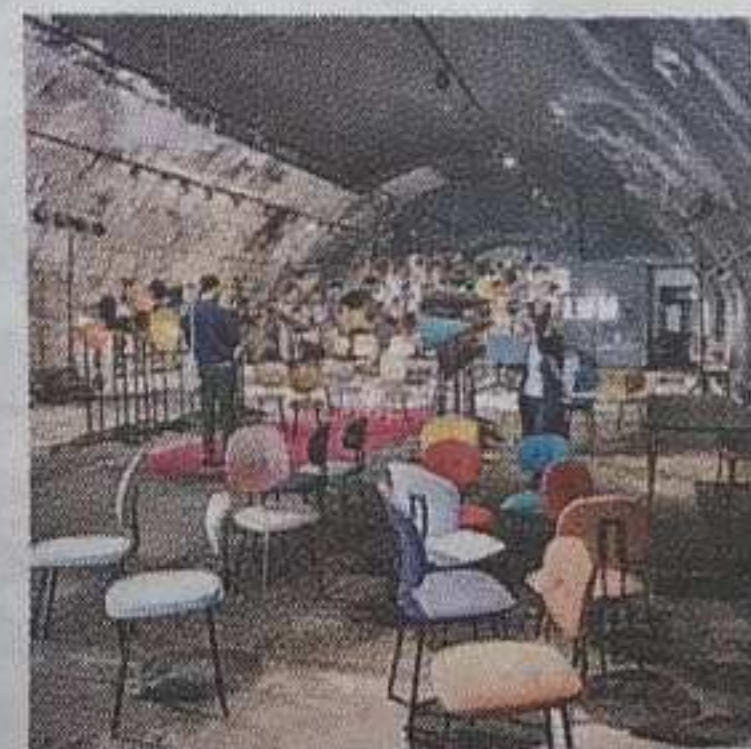
I Magazzini Raccordati l'anno scorso

Tra piazza XXV Aprile, via Pasubio, corso Como e dintorni si annuncia invece la nascita del nuovo Innovation Design District che lo scorso anno aveva debuttato con conversazioni alla Microsoft House e coordina tante diverse realtà, dal cinema all'arte al cibo. A poche centinaia di metri a The Mall si viaggerà nel futuro per interpretare l'abitare su Marte con